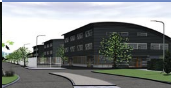
Entee van bedrijvenpark.