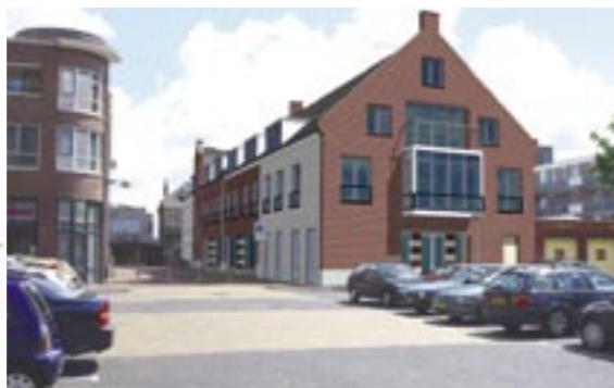
Foto realistische impressie van winkels met woningen.

"Architectenburo Hans Bakker is een relatief klein bureau, net als Hoogvliet Beheer. Bescheiden maar met veel creativiteit en slagkracht. Groot in daden, klein in verplichtingen. Zoals wij zeggen: Small is beautiful!" ■