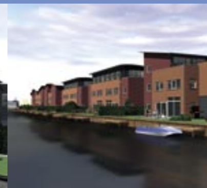
Directie woning aan het water