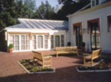
Vergadercentrum in koetshuis en orangerie.