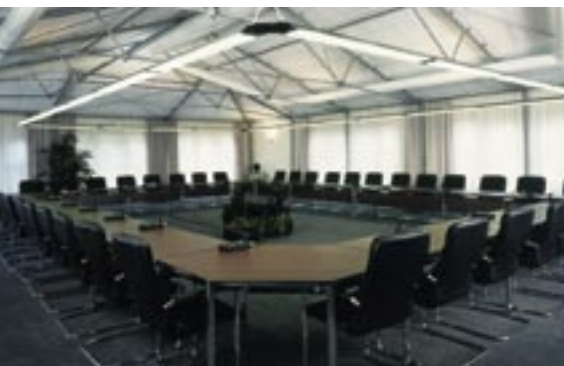
Interieur conferentie zaal.

EEN OMVANGRIJKE KLUS DIE WERD GEREALISEERD IN EEN TIJDSBESTEK VAN SLECHTS 13 MAANDEN.