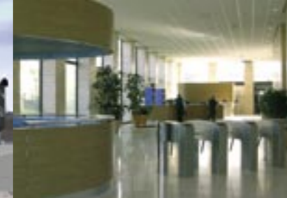
Entree met toegangscontrole.

EEN OMVANGRIJKE KLUS DIE WERD GEREALISEERD IN EEN TIJDSBESTEK VAN SLECHTS 13 MAANDEN.