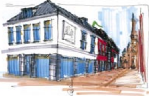
Schetsen voorstel bebouwing Kerkstraat.